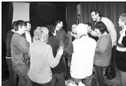
První schůze nového výboru