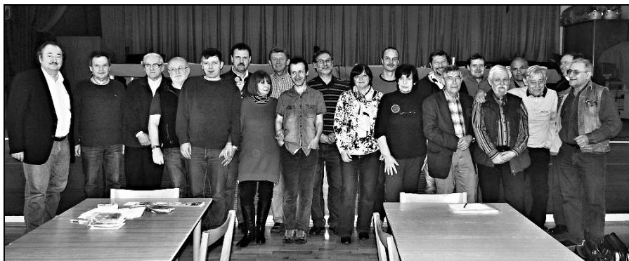
Členové nově zvoleného výboru a revizní komise na valné hromadě 2016