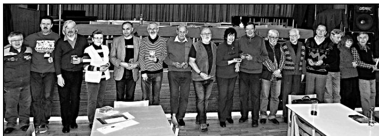
Dosavadní nositelé zlatého otazníku v jeho nové podobě na VH 2015